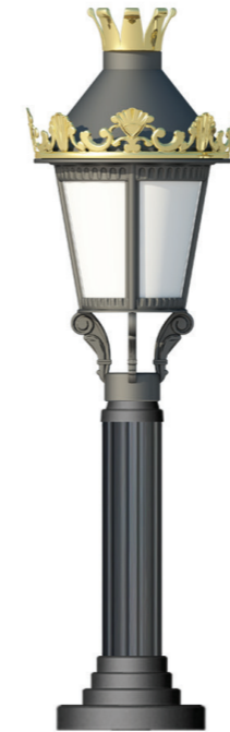
Code:BS 9027- B