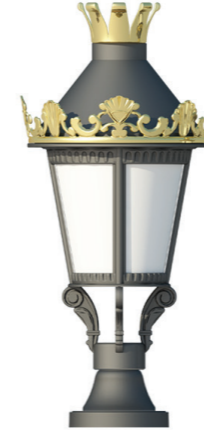
Code:BS 9027- S